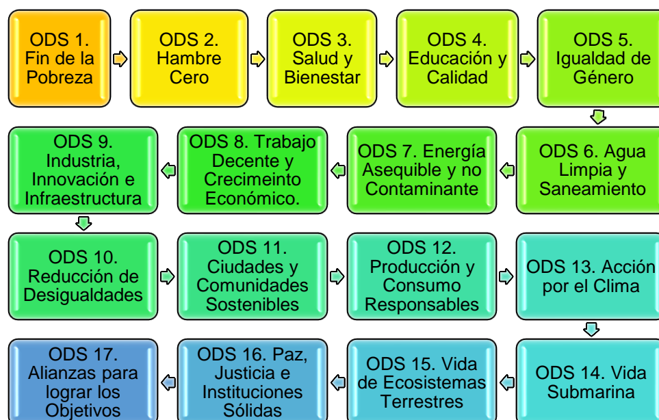
Figura 1 Objetivos de Desarrollo Sostenible

Nota. Información tomada de la Agenda 2030