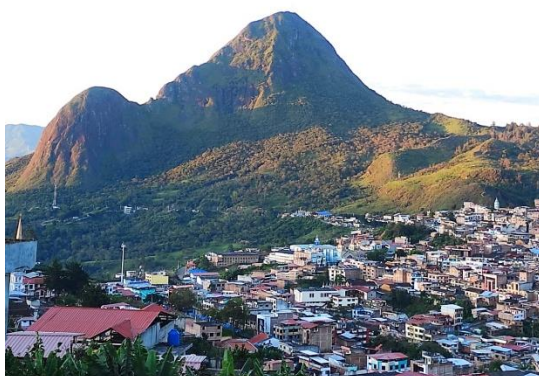
Cerro Ahuaca Cariamanga

El Cerro Ahuaca se ubica en la ciudad de Cariamanga en la provincia de Loja, al sur de Ecuador. Es una montaña reconocida por su riqueza en flora y fauna. Su altitud máxima es de 2403 m s.n.m, donde se albergan diversos ecosistemas que sustentan una amplia