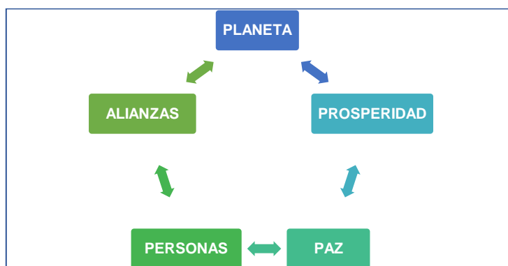
Elementos fundamentales de los ODS

Nota. Elementos en los que trabajan los objetivos de desarrollo sostenible. Elaboración propia.