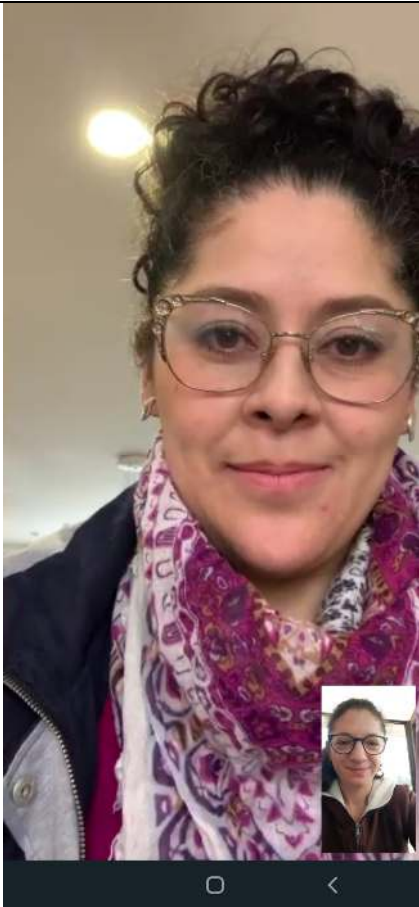
Fotografía 1. Video llamada con la docente