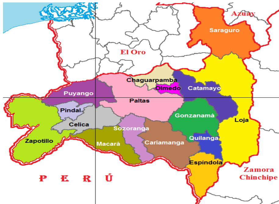
Figura 1: Provincia de Loja

La provincia de Loja cuenta con una gran variedad de climas (PD y OT de la Provincia de Loja, 2013): Clima tropical seco, Clima ecuatorial semihúmedo, Clima ecuatorial seco y Clima ecuatorial frío de alta montaña; se caracteriza principalmente por una abundante presencia de lluvias durante todo el año.