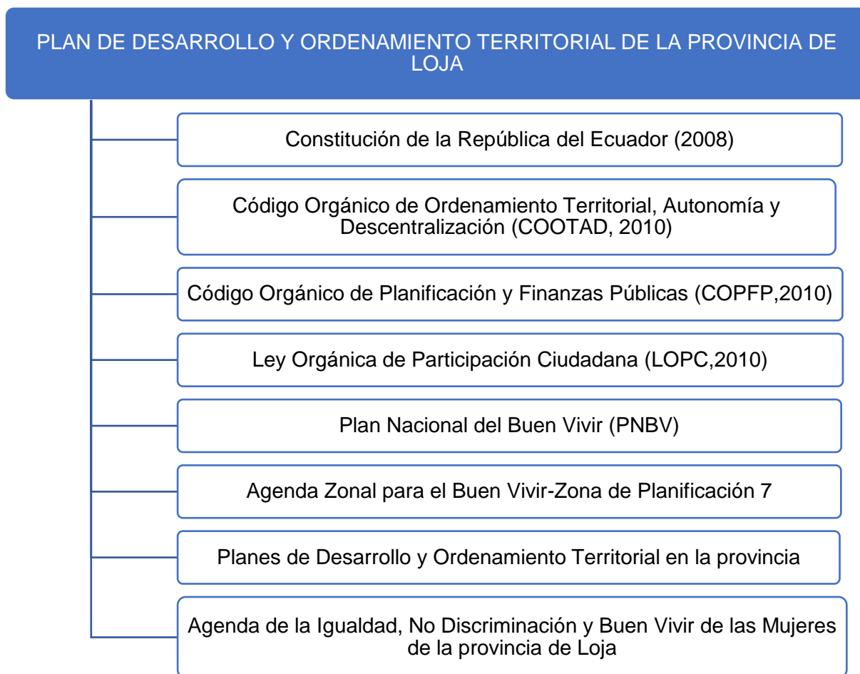
Tabla 3. Marco Legal PD Y OT en Jerarquía