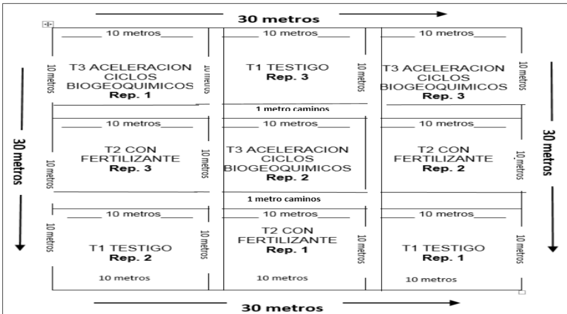
Figura 1: Diseño experimental.

En la figura 1 se muestra el diseño experimental realizado en campo. T1 = Tratamiento testigo, T2 = Tratamiento ciclo biogeoquímico, T3 = Tratamiento con fertilización química, Rep. 1 = Repetición 1, Rep. 2 = Repetición 2 y Rep. 3 = Repetición 3.