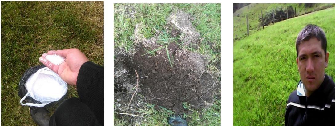
Figura 7: Fertilización mineral en (T3), toma de muestras de suelo, estado final de parcela (T2)