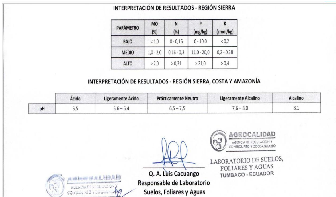
Figura 5: Resultados e Interpretación de los análisis realizados en laboratorio, correspondientes a los diferentes tratamientos, fin del proyecto.

Analizado por: Daniel Bedova. Kattv Pastás