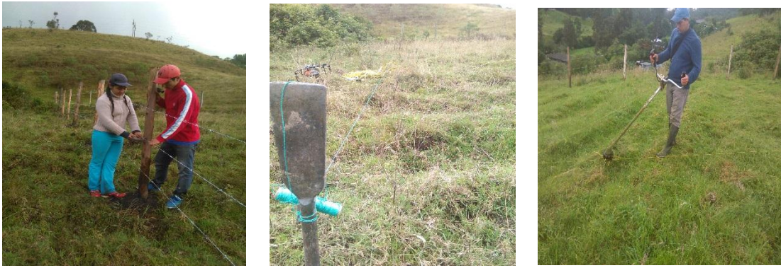
Figura 6: Cerramiento del terreno, delimitación de parcelas y corte de mantillo.