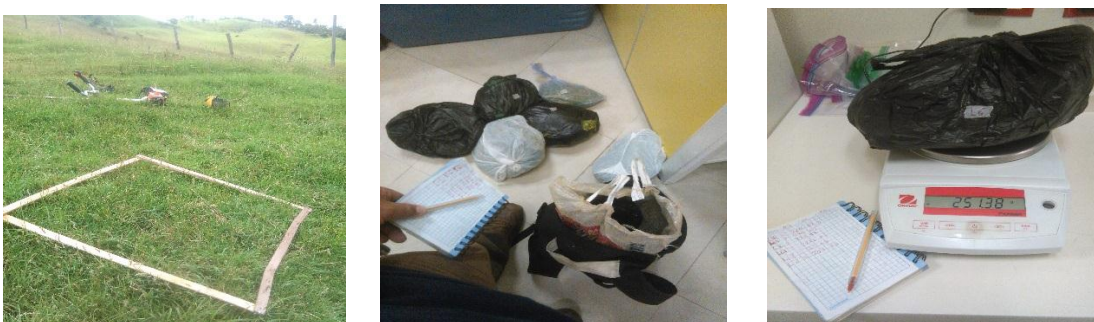
Figura 8: Recolección, etiquetado y peso de muestras (biomasa) en cada una de las parcelas.