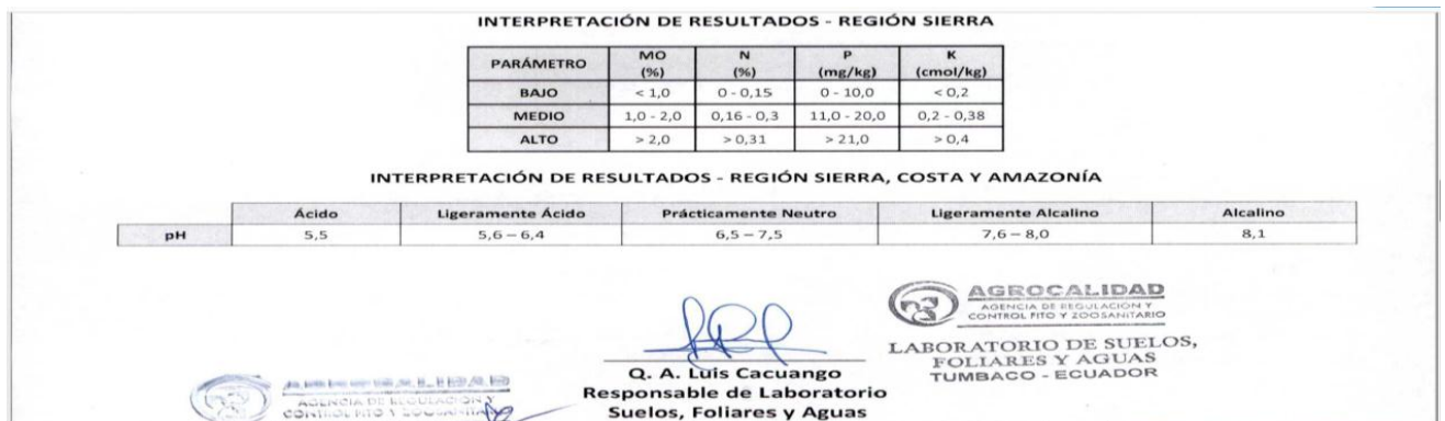
Figura 4: Resultados e Interpretación de los análisis realizados en laboratorio, correspondientes a los diferentes tratamientos, inicio del proyecto.