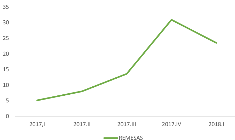
Figura 2. Emigración por región, 2010.

Con respecto a las remesas recibidas por la población de Gonzanamá, se tomó datos de Banco Central del Ecuador de las remesas recibidas a nivel cantonal del año 2017 y el primer trimestre del 2018, esto porque en este periodo se registra la mayor evolución de las remesas.